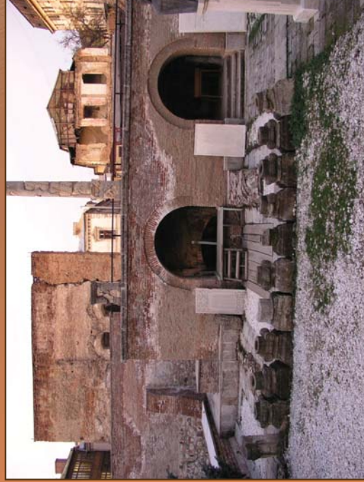
Curtea domnească din București

Curțile de la București și Târgoviște, Potlogi, Doicești, Obilești, Brâncoveni, Pitești, palatul de la Mogoșoaia sunt locuri de popas, mai scurt sau mai îndelungat pe traseele unei continue deplasări a domnitorului și a curții sale. Scopul major al artei brâncovenești este organizarea „desfătății” a vieții. Viața principelui nu se desfășura în intimitate, ci era într-un „frumos alaiu”, fiecare loc fiind e fapt o curte domnească, un spațiu care găzduia ceremoniile publice legate de persoana domnului, plimbarea, datul cu tunurile, proscălisirea la curte, audiența, îmbrăcăutul caftanului, divanul.