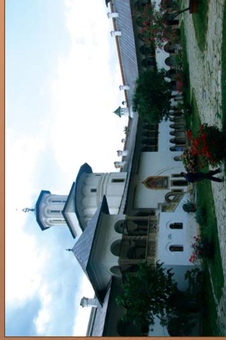
Casa domnească de la Hurezi