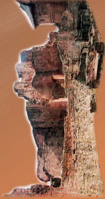
Ruinele curții domnești de la Târgoviște

Această locuire itinerantă descria trasee niciodată monotone, care erau probabil prestabilite dinainte.